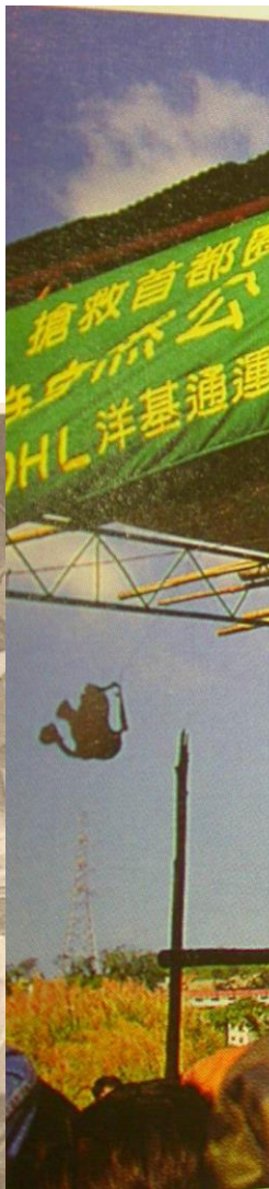
民衆踴躍簽名支持關渡自然公園早日成立